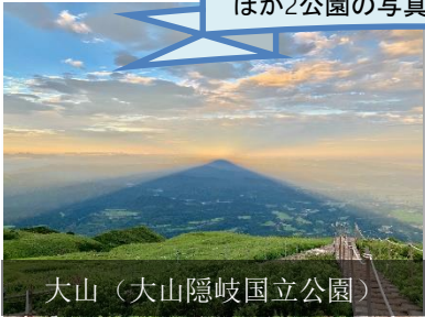
大山(大山隠岐国立公園)