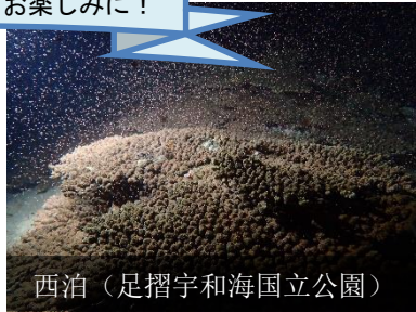
西泊(足摺宇和海国立公園)