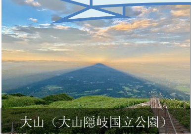
大山 (大山隠岐国立公園)