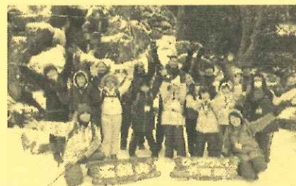
☆西条市市民活動活性化事業補助金活用事業での様子

「補助金を使ってどんな事業をしたの？」「申請書や報告書の書き方は？」など、昨年活用した団体さんに聞いてみよう！質問タイムもあり☆ぜひお気軽にご参加下さい！