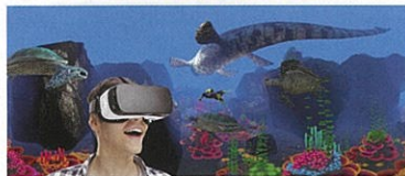
360度バーチャルリアリティ(仮想現実)体験 古代の海にタイムスリップ