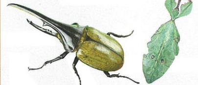
▲ヘラクレスオオカブト

世界の様々な自然環境の中で独自の進化を遂げた、ふしぎな色や形の昆虫たちを紹介します。香川県にすんでいる昆虫と比べてみましょう。