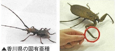
▲香川県の固有亜種 サヌキセダカコブ ヤハズカミキリ

水辺、草原、森林の環境ごとに、生息する昆虫を紹介。香川県ならではの昆虫の、拡大フィギュアも展示します。