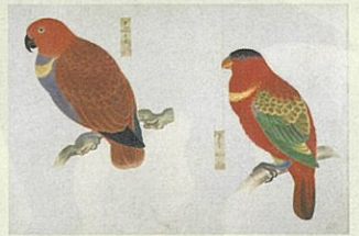
▲香川県指定有形文化財「衆禽画譜」