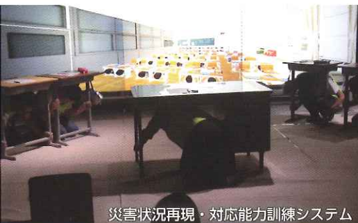
災害状況再現・対応能力訓練システム