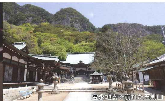
宝永地震で雨れた五剣山