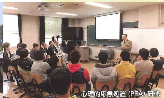
心理的応急処置(PFA)研修

主催：四国防災共同教育センター（四国防災共同教育センターは、香川大学、徳島大学、香川県、徳島県が構成員となります。）