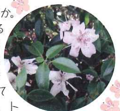
花には香りもあります。

「トキワバイカツツジ」という植物をご存じでしょうか。世界で唯一、愛媛県宇和島市津島町だけに自生するツツジで、国と愛媛県が絶滅危惧種に指定しています。地元でも知る人はごくわずか、今から30年ほど前に新種登録がされました。ふつうのツツジと違って落葉せず、4月後半から5月上旬にかけて薄ピンク色の梅の花のような花をつけることから、トキワバイカ(常葉梅花)ツツジと呼ばれています。