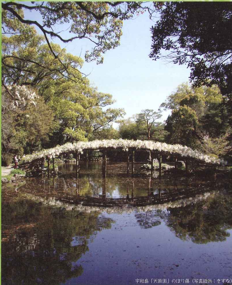
宇和島「天叡園」のほり藤