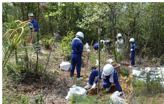
地元小学生と マツ苗植栽 (まんのう公園)